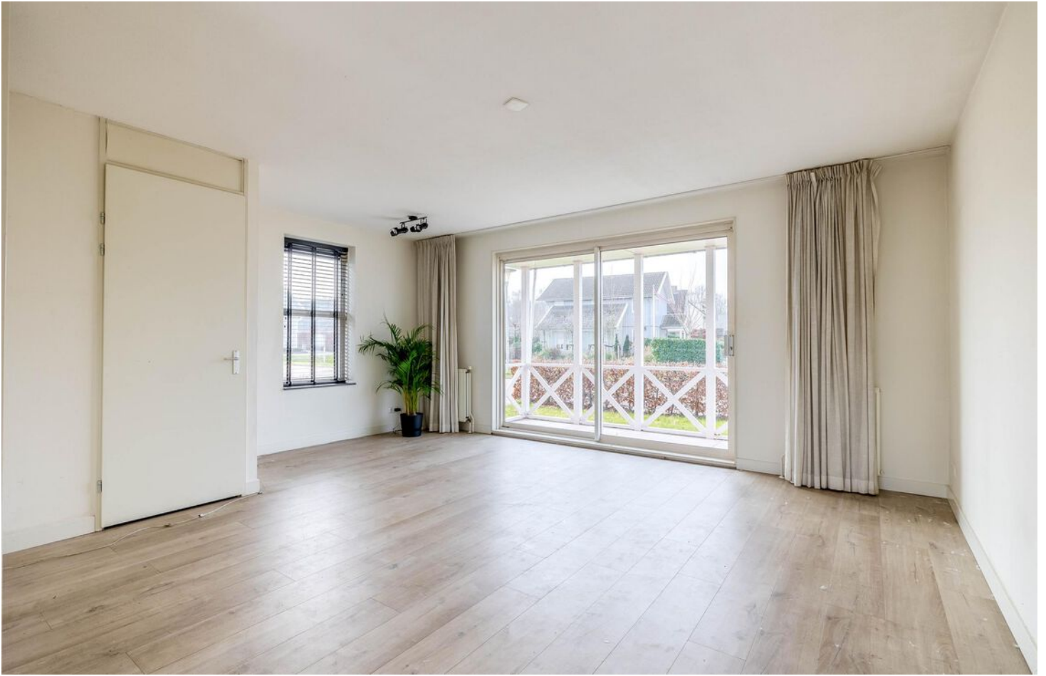
Artist Impression | Woonkamer